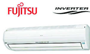
AWYZ 14 LBC