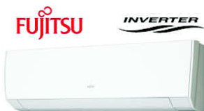
ASYG 14 LMCA