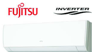
ASYG 12 LMCA