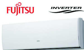
ASYG 14 LUCA