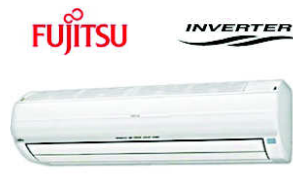
AWYZ 18 LBC