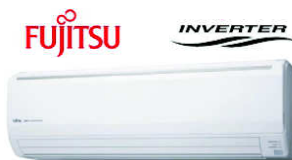
ASYG 18 LFCA